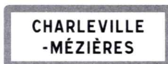
EB10 - 2 LIGNES